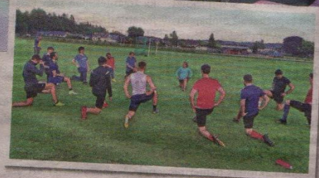
Det är inte många kvinnor som tränar herrfotboll.